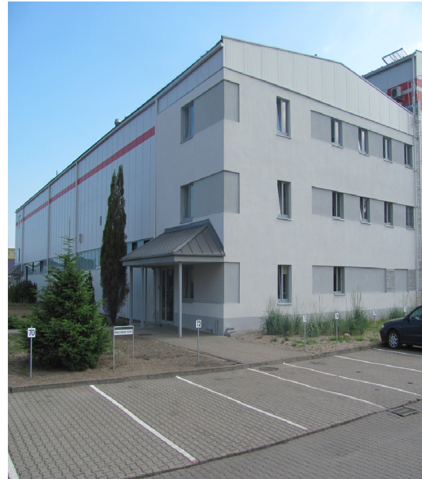
WYDZIAŁ PŁYT GRZEJNYCH I WIĄZEK